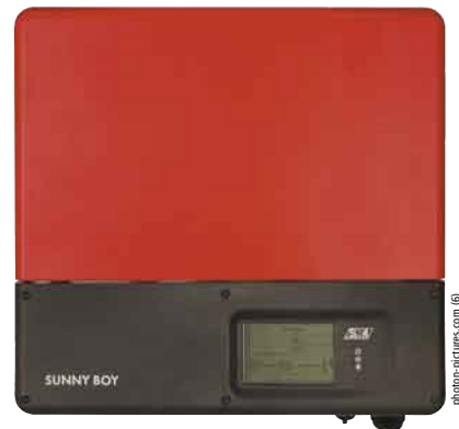
Im Test: Der SMA SB 5000TL-20