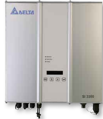
Im Test: der Delta Energy SI 3300