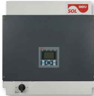
Im Test: der Refusol 11 K