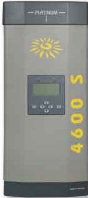
Im Test: der Diehl AKO Platinum 4600 S