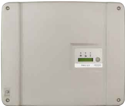
Im Test: Der Kostal Piko 10.1