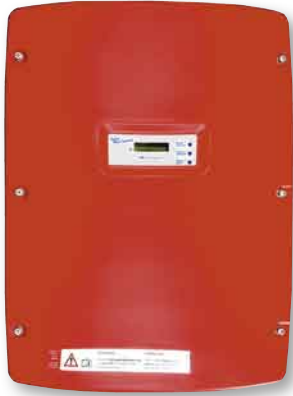
Im Test: der SMA SMC 8000TL