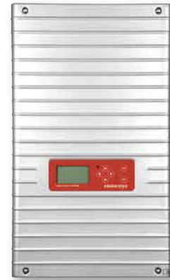
Im Test: der Sunways AT 4500