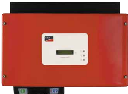
Im Test: Der SMA SB 2100TL