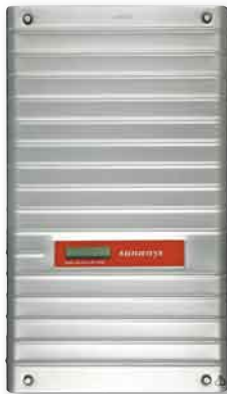
Im Test: Sunways NT 2600 2) unterer Spannungsbereich