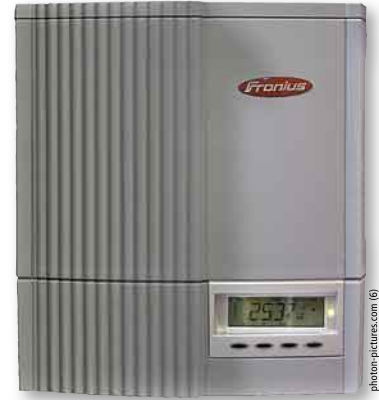
Im Test: der Fronius IG 30