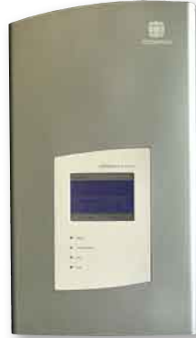
Im Test: der Conergy IP 5000 vision