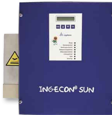
Im Test: der Ingeteam Ingecon Sun 3,3 TL