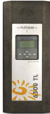
Im Test: der Diehl AKO Platinum 6300 TL