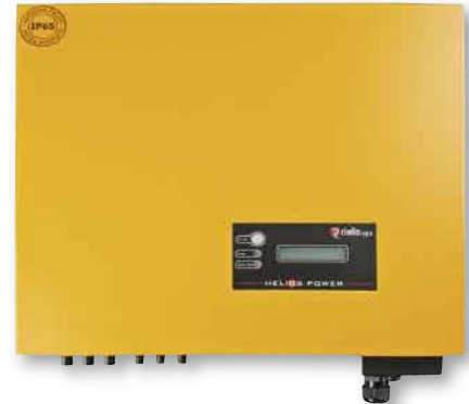
Im Test: der Riello HP 4065REL