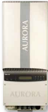
Im Test: der Power-One Aurora PVI-6000-OUTD-5