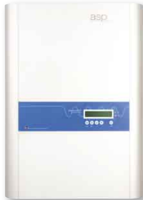
Im Test: der Solon Satis 40/750 IT