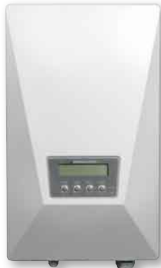
Im Test: der Mitsubishi PV-PNS06ATL-GER