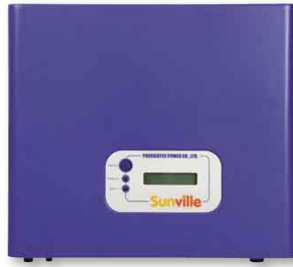
Im Test: der Phoenixtec PVG 2800