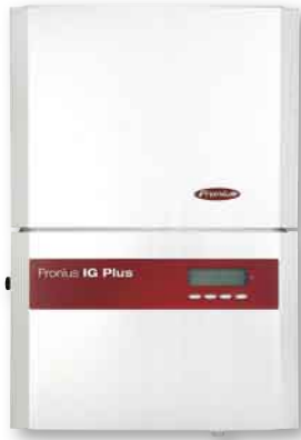
Im Test: der Fronius IG Plus 50