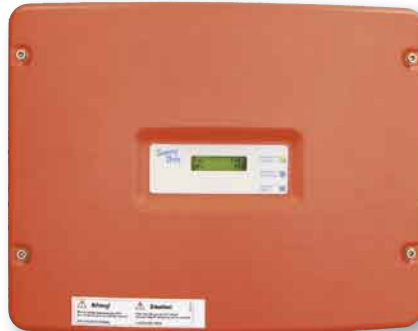
Im Test: der SMA SB 3800