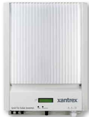
Im Test: der Xantrex GT5.0SP