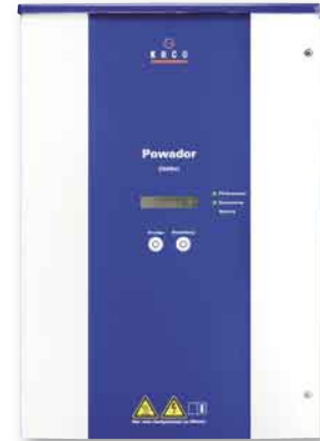
Im Test: der Kaco Powador 2500xi